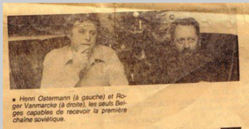
Extrait d'un article de journal de l'époque