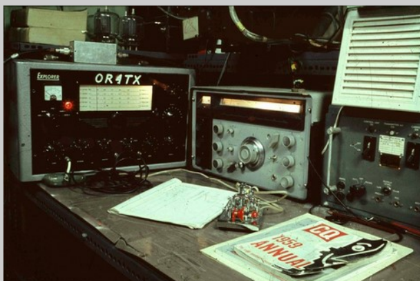
La station OR4TX

Roger ON4TX - OR4TX était l'un des sept opérateurs radio qui ont alterné leur présence tout en ayant été actifs depuis la base Roi Baudouin en Antarctique. C'est en 1960 (hivernage 1960 - 1961) que Roger participait à l'expédition scientifique belge dans cette région comme électronicien et opérateur radio. Il était accompagné de ON4TZ et ON4KR s'occupant eux particulièrement de l'électricité atmosphérique.